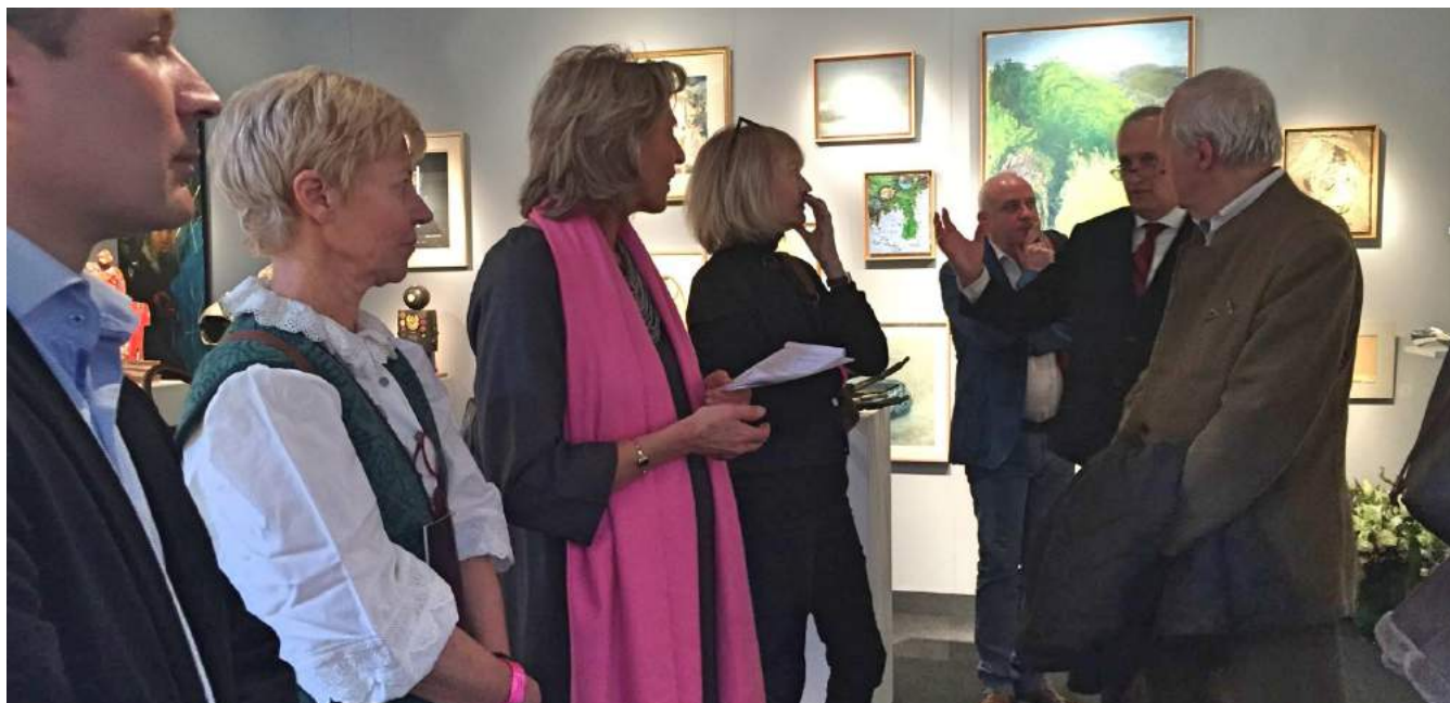
Visite de la BRAFA

Visites de musées, de foires mais aussi des expériences uniques, exclusives et confidentielles grâce aux visites d'ateliers d'artistes sont autant d'activités proposées aux membres.