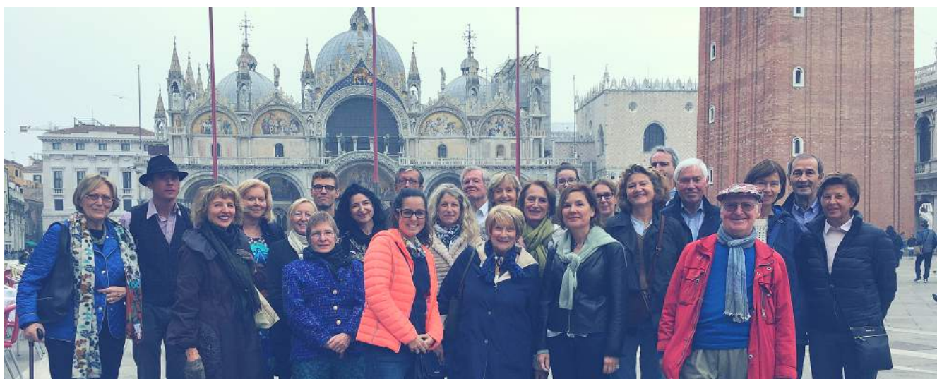
Biennale de Venise