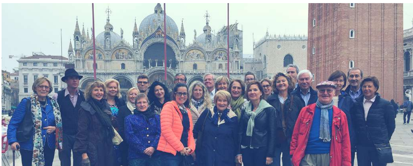
Biennale de Venise